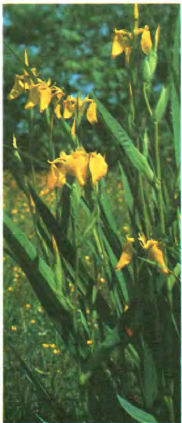
586. Півники болотні.